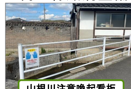
山根川注意喚起看板