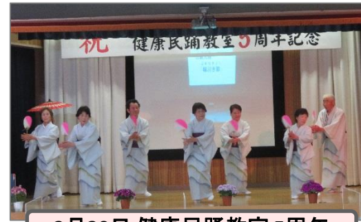
3月30日 健康民踊教室5周年