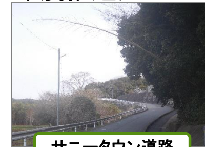
サニータウン道路

(3) 「見守り運動実施中」のぼり旗1日/月 → 1week/月として啓発効果向上をはかる