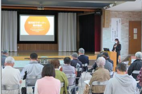
あったか見守り情報交換会

8月コロナで中止 11月船木あったか見守り活動情報交換会で同時開催 船木小学校 10月(保護者含め100名参加)