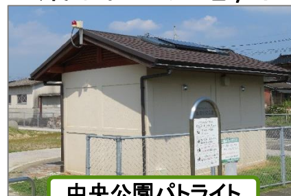
中央公園パトライト