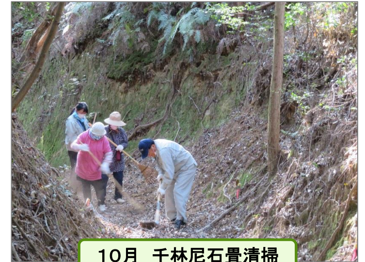
10月 千林尼石畳清掃