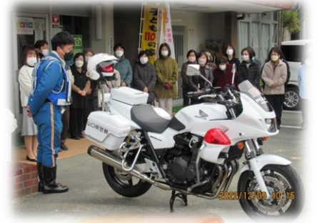
12/9（金）第五回 ～交通教室～

4月から令和5年度のいきいきがっこがスタートします。ご興味をお持ちの方は、ぜひ琴芝ふれあいセンターまでお問合せください！