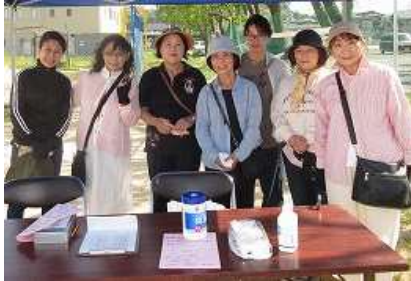
体育祭で受付担当

婦人部員は34自治会のうち17自治会から選出された方で構成されています。活動内容は地区行事に協賛参加、また独自の行事(福祉バザー6月頃・高齢者交通安全啓発訪問12月)を行っています。世代を問わず、皆様のお役に立てればと部員一同がんばっています。まもなく夏まつりがきます。婦人部のブースでは、現在開発中の新たなメニューをお出ししますのでぜひご賞味ください。地域の皆様の温かいご支援を受け、さらに活動の場を広げ、元気な鵜の島を目指していきます。今後とも宜しくお願いします。