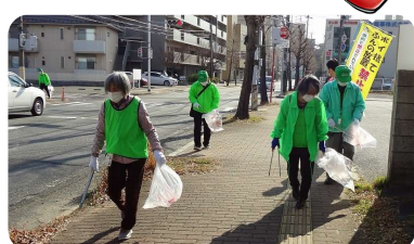
【新川地区環境衛生連合会】