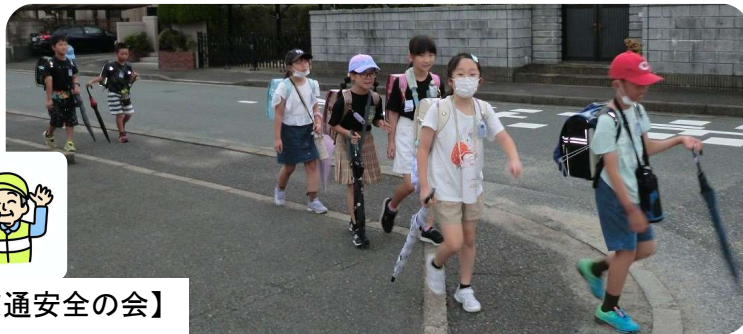
【新川交通安全の会】

初日の9月21日(木)、新川交通安全の会は、新川小学校正門及び裏門にて、街頭指導を実施しました。 子どもたちが、交通事故にあわないように呼びかけをしました。