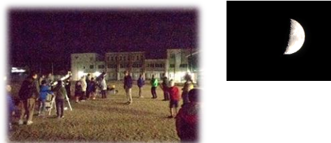
岬地区子ども委員会

秋の夜空を見てみよう！を開催しました。 天体望遠鏡で月のクレーターを見たり、木星、 土星の観察も出来ました。望遠鏡を覗いたと きに「見えた！！」と喜ぶ声があちらこちらで 聞こえました(*。*)