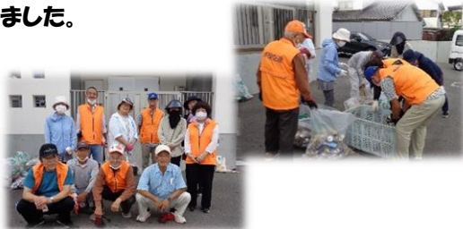
環境衛生連合会岬支部

宇部市一斉空缶等回収実施日でした。 朝早くから、空缶・空ビン・ゴミ等を拾い、セン ターに持ってきてくださって、ありがとうございました。