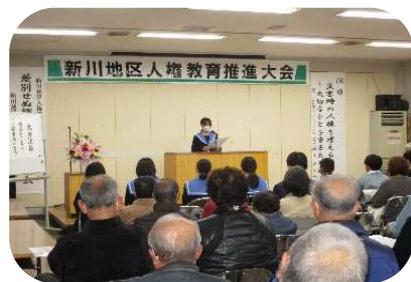
【新川地区人権教育推進委員協議会】