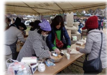
岬地区コミュニティ協議会