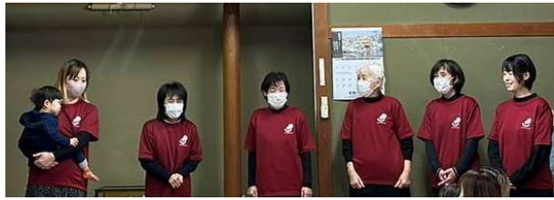
母推さん メンバー

サークルに参加した子どもたちが小学生、中学生と大きくなる姿をみるのもまた楽しみです。子どもたちみんなの笑顔のために歩み続けます。地区に根ざし、未来を担う子どもたちの健やかな成長を支えていくこと♡応援します。