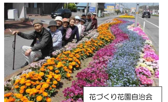
花づくり花園自治会