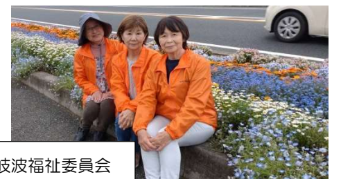
東岐波福祉委員会