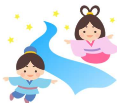
【新川ふれあいセンター】