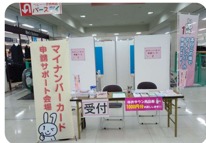
【宇部市 マイナンバーカード推進課】