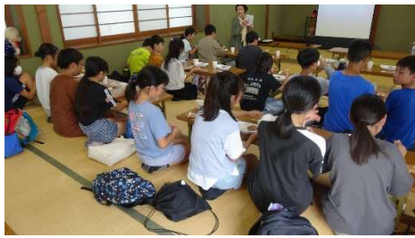
「いじめ」について人権教育

2月には人権大会を開催します。人権を尊重する思いや態度を身につけるために、ぜひ参加してみてください。私たち人権委員14名は地区の皆さんとともに学び、多様性を認め合う鵜の島になることを願って、活動を続けていきます。