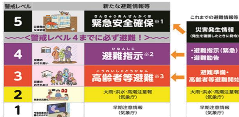
画像：内閣府「新たな避難情報に関するポスター・チラシ」より

1923年9月1日の関東大震災が起きた日に由来し、「防災の日」が制定され、全国各地で防災訓練等が行われるようになりました。西宇部地区においても、8月25日に防災訓練を実施し、いつ起きてもおかしくない災害に対する、防災意識を学ぶ一日となりました。「備えあれば憂いなし」 ①避難場所 ②防災用品 ③連絡手段の「確認」をしておきましょう。