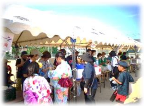
大賑わいのバザーコーナー