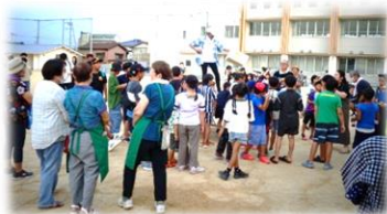
発表にみんなドキドキ！