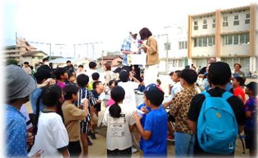
岬くじ 誰に当たるかな？