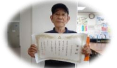
岬18区 松本自治会長

8月19日(月) 第37回宇部市環境衛生大会が開催され、再生資源集団回収推進優良団体に岬18区自治会が選ばれました。 宇部市長より感謝状をいただきました。 おめでとうございます！