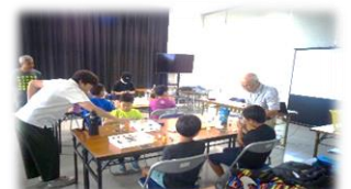
8/19 ミニソーラーカー工作 岬地区子ども委員会