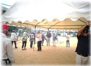
テント張りは一苦勞…

8月24日(土) 岬小学校グラウンドにて岬地区夏まつりを開催しました。 今年は、真夏の暑い時期をさけて、日程を8月下旬にずらしました。しかし、まだまだ日中は日差しがギラギラ…役員の皆さんは朝早くから、祭りの準備にテント張りなど大忙し！ 昨年に引き続き、夏まつりのメインは岬くじ(*~*) 今年も36人に当たりがありました。 1等は1万円の商品券が2人の方に、おめでとうございます！ 皆さん、楽しんでもらえましたか？ たくさんのご来場ありがとうございました！！