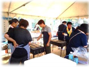
準備に汗だくの役員さん達