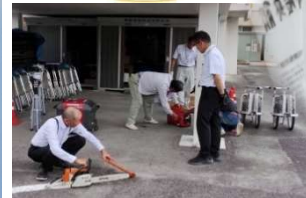
防災資機材の点検