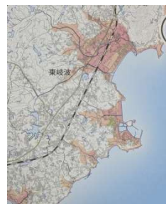
高潮レッドゾーン