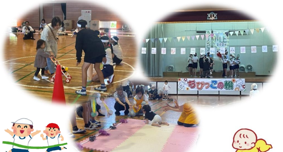
【母子保健推進員会・母親クラブ・民生児童委員協議会】

秋晴れの中、川上小学校体育館でちびっこの輪うんどう会～ちびりんピッ ク川上2024が開催されました。参加したちびっこは35人、6年生の お兄ちゃん・お姉ちゃんが体操やダンス、競技のお手伝いをしてしてくれまし た。オープニングは火の神様が聖火を持って入場し、校長先生はステージ 上の聖火台に点火して開会宣言をされました! 競技はかけっこやハイハイレース、ミッキーさんとお散歩など…広い体育 館の中を元気に走り回ったりしていました。 お兄ちゃんお姉ちゃんありがとうございました♪来年もよろしくね。