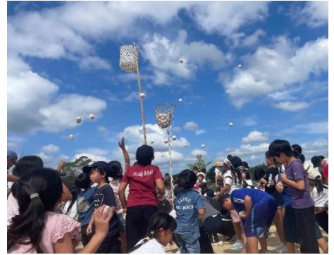
【コミュニティ推進協議会/体育振興会】