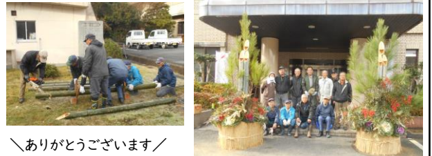
＼ありがとうございます！＼