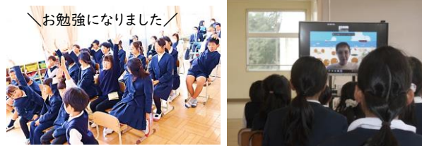
＼お勉強になりました！＼

12月5日(木)小野小学校で児童と保護者や地域の大人が「外国人の人権」をテーマに学習しました。東京からオンラインで、外国人講師の先生にお話をいただきました。自ら6カ国を転校した体験に基づき、各国の学校の違いから、相手を理解することと自分の「個性」を大事にすることを教えてくださいました。