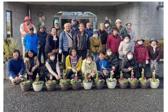
【まちづくりサークル】