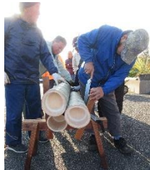
【自治会連合会・シニアクラブ】