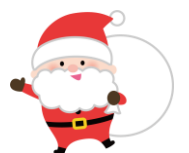
母子保健推進員会 母親クラブ 民生児童委員協議会