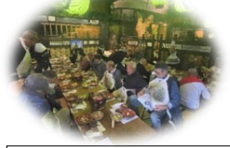
自治会連合会 環境衛生連合会川上支部 婦人部連絡協議会