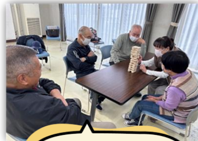
ジェンガに挑戦! 試行錯誤しながら も大盛況!

※内容の詳細確認やご予約については、琴芝ふれあいセンターまでご連絡ください。TEL0836-21-1534