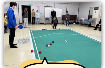
初のボッチャ! 白熱の戦いでした!