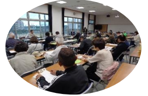
岬地区自主防災会

4月23日（水）令和7年度総会を開催しました。今年度の計画や予算など承認をいただき、いよいよスタートです。役員の方々に、ご協力をお願いします。