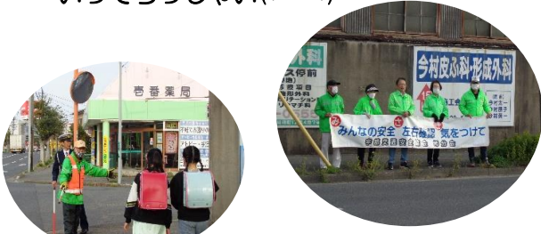
交通安全協会岬分会

4月8日（火）春の全国交通安全運動中、ローソン宇部明神町前交差点にて、朝の立哨を行いました。子ども達の元気なあいさつを聞いて、役員も元気になりました。通学中、交通安全に気を付けて！ いってらっしゃい(*^-^*)